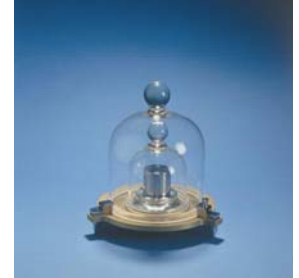
Padrão Nacional do kg, cópia n.º 69 do padrão internacional K

O quilograma teve a sua origem nas reformas da revolução Francesa. O seu nome original era "grave" mas em 1795 foi alterado para quilograma. Conceptualmente, a sua definição tinha por base a massa de um decímetro cúbico de água destilada, no vácuo, no seu ponto de congelação. Em 1875, após várias tentativas falhadas na construção de um protótipo cilíndrico de platina iridiada, a convenção Métrica originou a criação do BIPM que deu um novo impulso na criação do novo protótipo, entregando essa tarefa a uma firma de Londres com o nome Johnson Matthey and Co. . Em 1879, a mesma firma fabricou três cilindros de platina iridiada, tendo sido atribuído ao terceiro cilindro a designação de protótipo internacional do quilograma (IPK). A definição do quilograma por intermédio da água foi abandonada e o IPK tornou-se o padrão (K) do quilograma. Em 1889 foram criadas 40 cópias do quilograma K. Destas, 34 cópias foram entregues aos 21 Países (incluindo Portugal) que as encomendaram, tendo a entrega sido efectuada durante a conferência geral de pesos e medidas desse ano, tornando-se os seus padrões primários do quilograma.